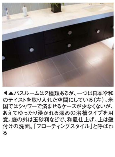
バスルームは2種類あるが、一つは日本や和のテイストを取り入れた空間にしている(左)。米国ではシャワーで済ませるケースが少ないが、あえてゆったり浸かれる深めの浴槽タイプを用意。庭の外は玉砂利などで、和風仕上げ。上は壁付けの洗面。「フローティングスタイル」と呼ばれる